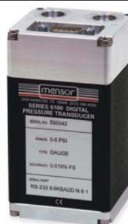
デジタル圧カトランスデューサ モデル CPT6100